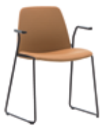
Sled base armchair Sillón con pie varilla