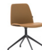
Aluminum swivel base Base giratoria de aluminio