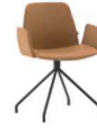
Steel swivel base Base giratoria de acero + upholstered arms / brazos tapizados