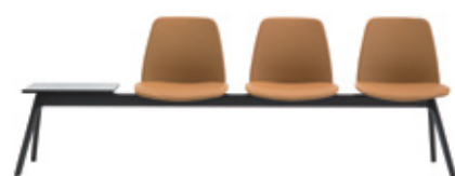
Bench 2-5 seater Banco 2-5 plazas