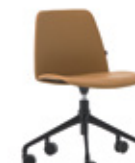
Aluminum swivel base Base giratoria de aluminio + casters / ruedas