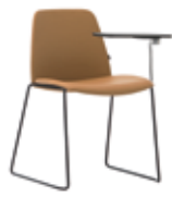
Sled base Pie de varilla + writing tablet / pala escritura