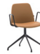
Aluminum swivel base Base giratoria de aluminio + metal arms / brazos metálicos