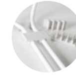
Linking clips Clips de unión