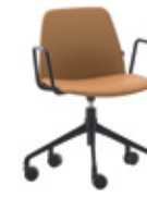
Aluminum swivel base Base giratoria de aluminio + metal arms / brazos metálicos + casters / ruedas