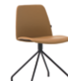
Steel swivel base Base giratoria de acero