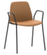
4 leg w/steel arms Sillón con 4 patas