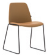
Sled base Pie de varilla