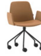
Steel swivel base Base giratoria de acero + upholstered arms / brazos tapizados + casters / ruedas