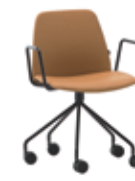
Steel swivel base Base giratoria de acero + metal arms / brazos metálicos + casters / ruedas