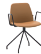
Steel swivel base Base giratoria de acero + metal arms / brazos metálicos