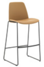
Sled base stool Taburete base varilla high / alto