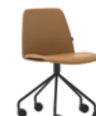
Steel swivel base Base giratoria de acero + casters / ruedas