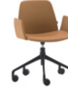
Aluminum swivel base Base giratoria de aluminio + upholstered arms / brazos tapizados + casters / ruedas