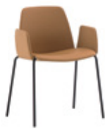
4 leg armchair Sillón 4 patas + upholstered arms / brazos tapizados