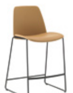
Sled base stool Taburete base varilla medium / medio