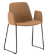
Sled base armchair Sillón pie de varilla + upholstered arms / brazos tapizados