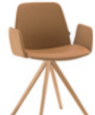
Wooden swivel base Base de madera giratoria + upholstered arms / brazos tapizados