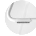
Felt glides for rod Tacos fieltro para varilla