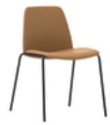
4 leg 4 patas