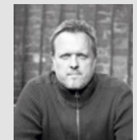
UNNIA TAPIZ Designed in London by Simon Pengelly www.simonpengelly.com