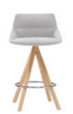
— Wooden swivel base Base giratoria madera medium / medio