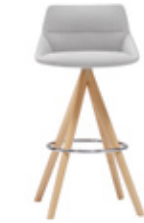
— Wooden swivel base Base giratoria madera high / alto