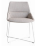
— Sled base Pie varilla