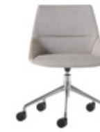
— Aluminium swivel Giratoria de aluminio + casters / ruedas