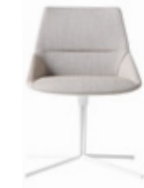
— Flat swivel base Base plana giratoria