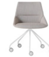
— Trestle swivel base Base giratoria piramidal + casters / ruedas