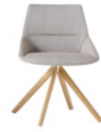
— Wooden swivel base Base giratoria madera