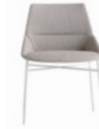
— 4 leg base Pie 4 patas