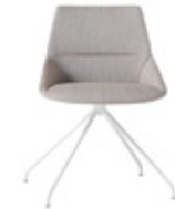
— Trestle swivel base Base giratoria piramidal