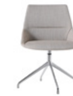
— Aluminium swivel base Base giratoria de aluminio