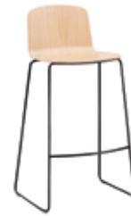
Sled base stool Taburete base varilla high / alto