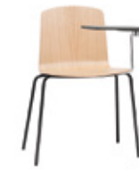
4 leg 4 patas + writing tablet / pala escritura