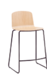
Sled base stool Taburete base varilla medium / medio