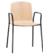
4 leg with arms 4 patas con brazos