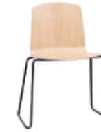
Sled base Base varilla