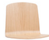
Wooden shell Carcasa de madera