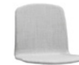
Fully upholstered shell Carcasa tapizada