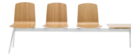
Bench 2-5 seater Banco 2-5 plazas