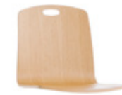
Wooden shell w/ hand hole Carcasa de madera con asa