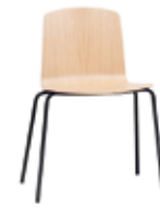
4 leg 4 patas