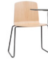
Sled base Base varilla + writing tablet / pala escritura