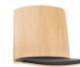
Upholstered seat Asiento tapizado