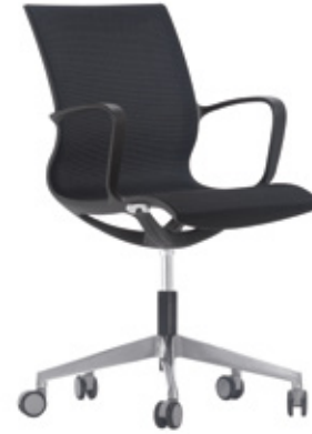
— Black structure Estructura negra