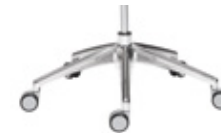
— Polished aluminum base Base de aluminio pulido + casters / ruedas