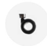
— Hollowed twin castor Ruedas dobles de eje hueco