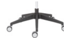
— Polyamide base Base de poliamida + casters / ruedas