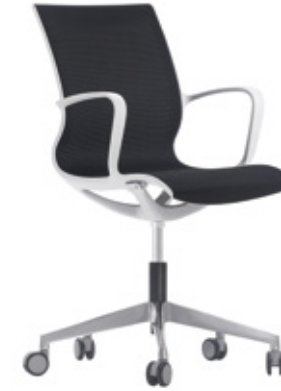
— Light grey structure Estructura gris claro