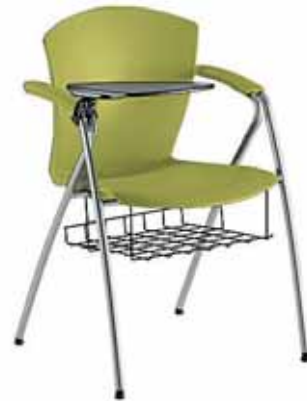
Mod. CA-692-01 + op. CA-722 CH/TPN