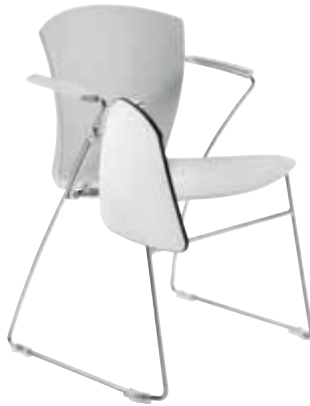
Mod. CA-1411 CH/BSK