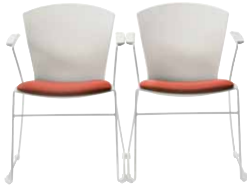
Mod. CA-1408-01 + op. CA-613