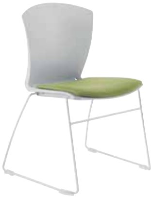
Mod. CA-1402 + op. CA-613