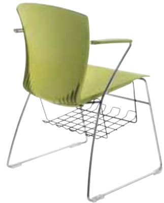
Mod. CA-1407 + op. CA-703