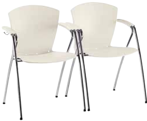
Mod. CA-692 + op. CA-713