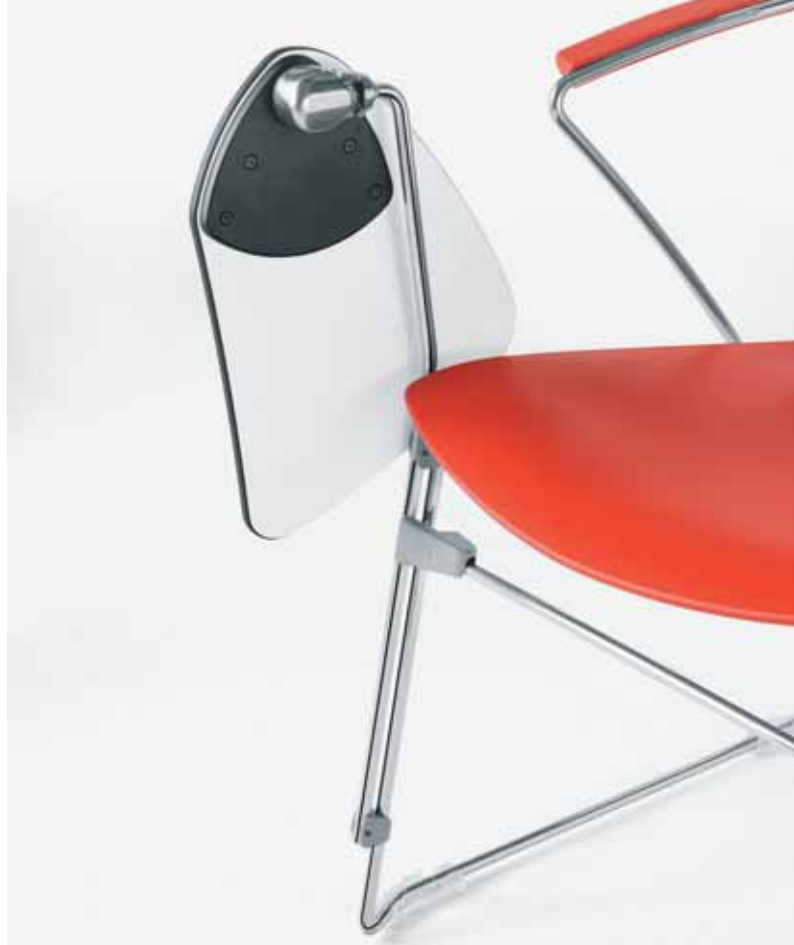
TP/FAST scrittoio | writing tablet | tablette écrioire | Schreibbrett