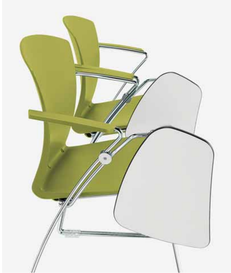
CH/BSK scrittoio, sedia impilabile | writing tablet, stackable chair | tablette écriteire, chaise empilable | Schreibbrett, Stapelstuhl