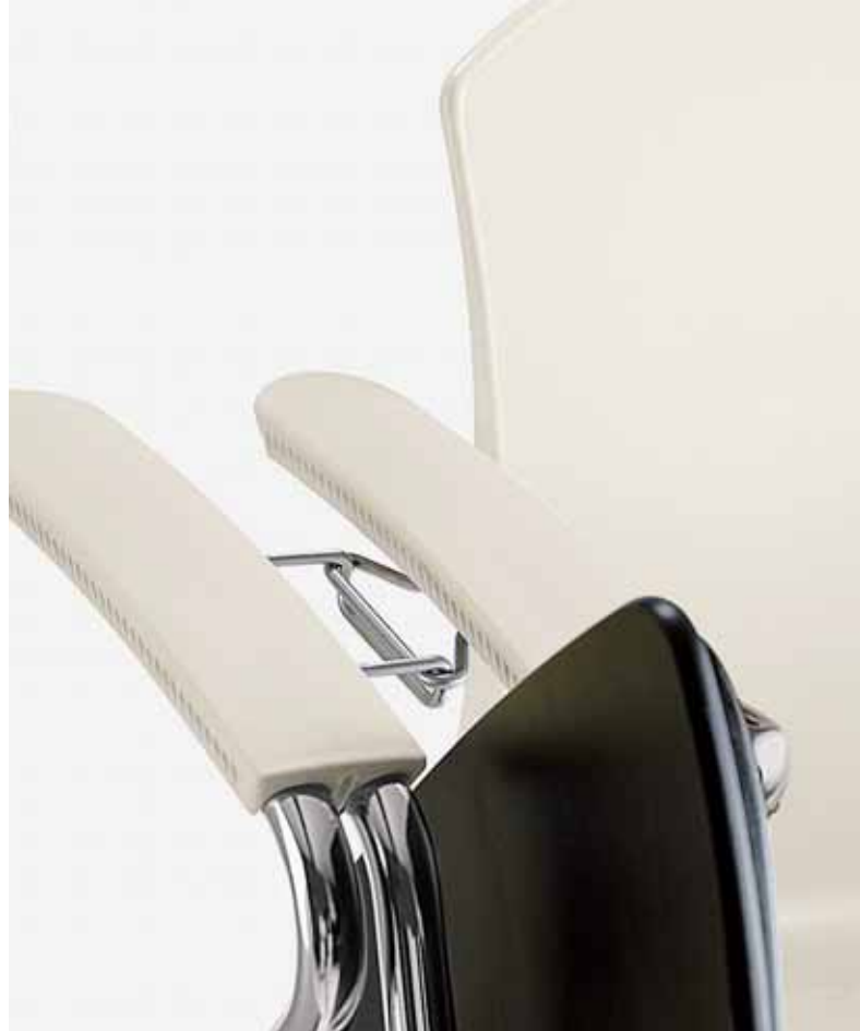
CH/TPN scrittoio, sedia impilabile | writing tablet, stackable chair | tablette écrioire, chaise empilable | Schreibbrett, Stapelstuhl