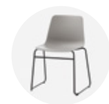
— Reinforced sled base Base de varilla reforzada