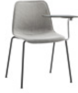
4 leg writing tablet 4 patas pala escritura