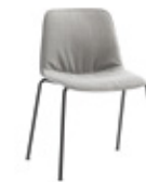
— Soft fibre upholstery Tapicería fibra suave