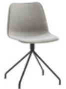
Steel swivel base Base giratoria de acero