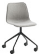
Aluminum swivel base Base giratoria de aluminio + casters / ruedas