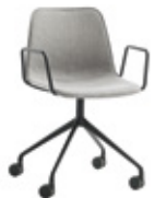
Aluminum swivel base Base giratoria de aluminio + arms / brazos + casters / ruedas