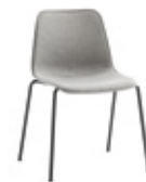
— Plain upholstery Tapicería lisa