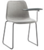
Sled base writing tablet Pie de varilla pala escritura