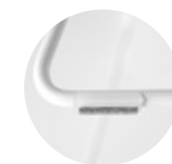
— Felt glides for rod Tacos fieltro para varilla