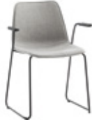
Sled base armchair Sillón pie de varilla