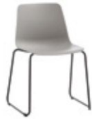
Sled base Pie de varilla