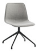
Aluminum swivel base Base giratoria de aluminio