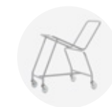
— Trolley Carro