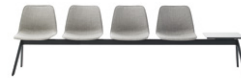
Bench 2-5 seater Banco 2-5 plazas