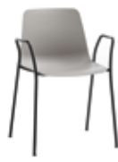
4 leg armchair Sillón 4 patas