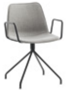
Steel swivel base Base giratoria de acero + arms / brazos