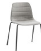
— Horizontal stitching Costuras horizontales