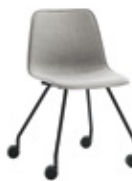
4 leg base Base 4 patas + casters / ruedas